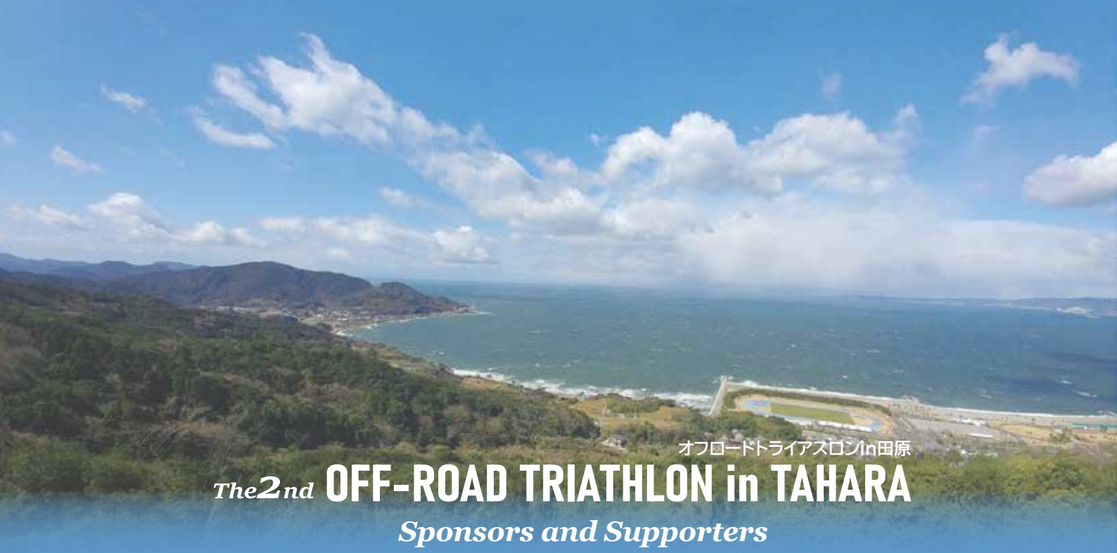
オフロードトライアスロンin田原